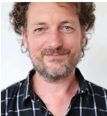
Raoul Baumann Pianiste | Comédien