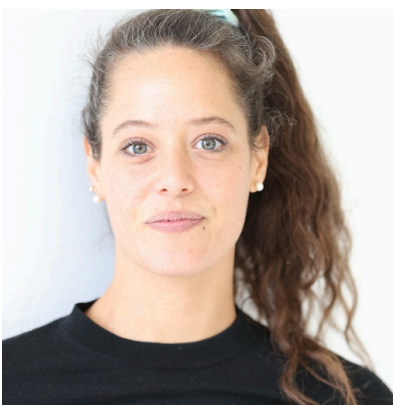
Selina Szekelyi Circassienne | Comédienne