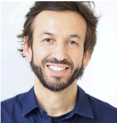
Patjé Auteur | Chanteur | Comédien