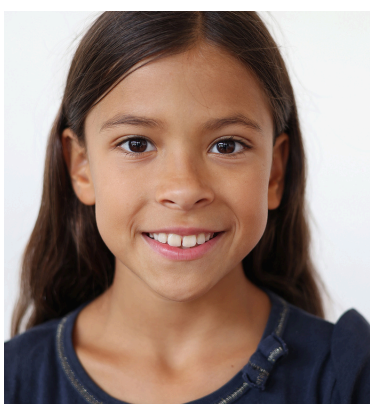
Talia Jauffret Comédienne